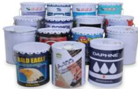
รูปตัวอย่าง กลุ่ม 2