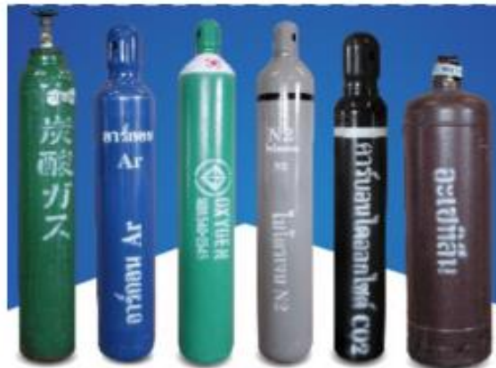
รูปตัวอย่าง กลุ่ม 1